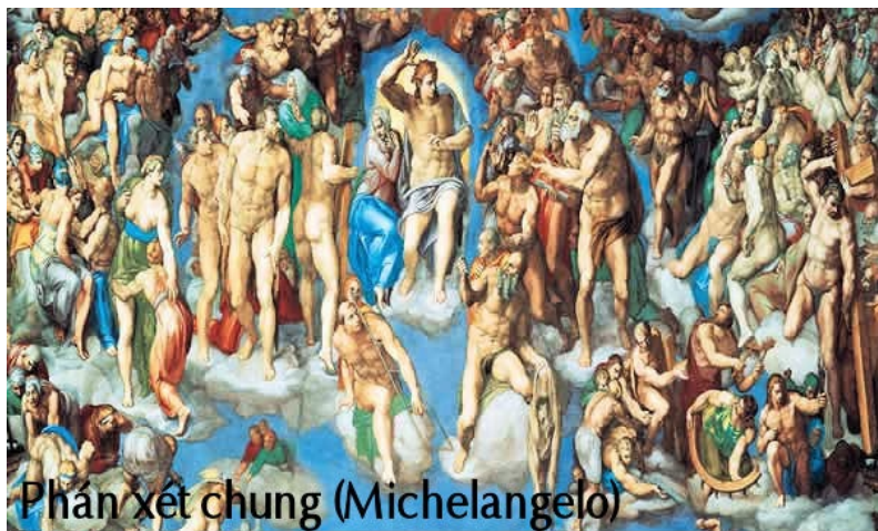
Phản xét chung (Michelangelo)

Sa-un, Sa-un, tại sao người bắt bớ Ta? Thưa Ngài, Ngài là ai? Ta là Giêsu mà người đang bắt bớ