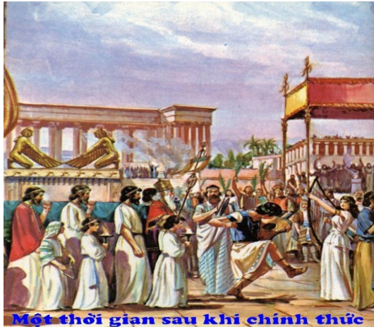
Một thời gian sau khi chính thức lên vua, David đã tổ chức long trọng đón tiếp Hòm Bia Giao ước. Nhà vua múa nhảy trước Hòm Bia để hân hoan ca tụng Chúa.

Các Thánh Vịnh được sưu tập từ thế kỷ X, là đương thời của vua Đavít, đến thế kỷ V trước Chúa Giáng Sinh. Gồm 150 bài, được chia thành 5 tập theo mẫu của Ngũ Kinh: Sáng Thế, Xuất Hành, Lê Vi, Dân Số và Đệ Nhị Luật; nghĩa là theo mẫu của Luật (Torah), nền tảng của Cựu ước. Điểm này nói lên tầm quan trọng có tính cách nền tảng của Thánh Vịnh đối với dân Do thái. Thánh Vịnh là bài thơ sáng tác để hầu chuyện với Thiên Chúa